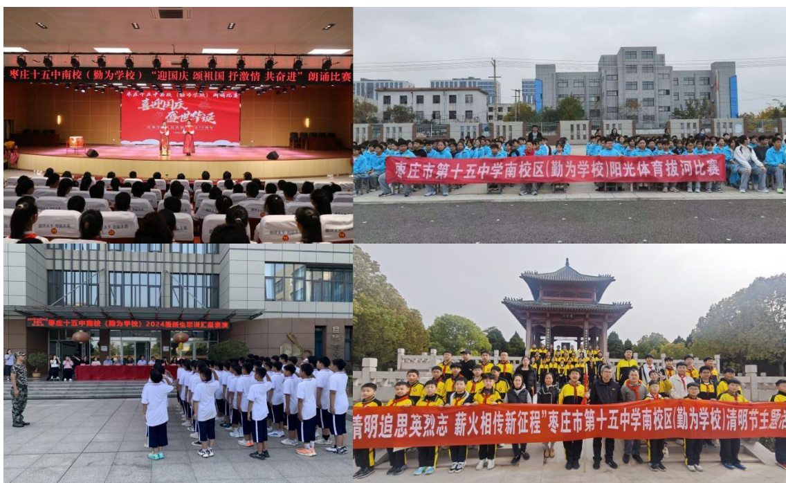
市中区2025年秋季报刊订阅情况分析表

空间进行升级利用，搭建高标准心理活动室、心语活动室等文化角，并在校园绿植区增设“我和小树共成长”立志标语牌 10 块，实现“一步一景、一墙一育”。常态化开展爱国主义教育：每周升旗仪式融入“国旗下的思政课”，国庆期间举办“我和我的祖国”主题诵读会，清明组织徒步祭扫；端午包粽、中秋制饼等传统节日活动覆盖全体学生，学校获评“市中区书香校园”，图书报刊发行增订在市中区排名第一，美术社团作品获评市级一等奖。