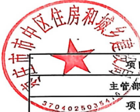
政策和项目预算绩效目标表 (2026年度)