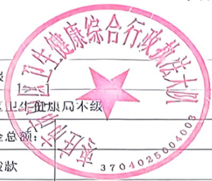
项目支出绩效目标表 (2024年度)