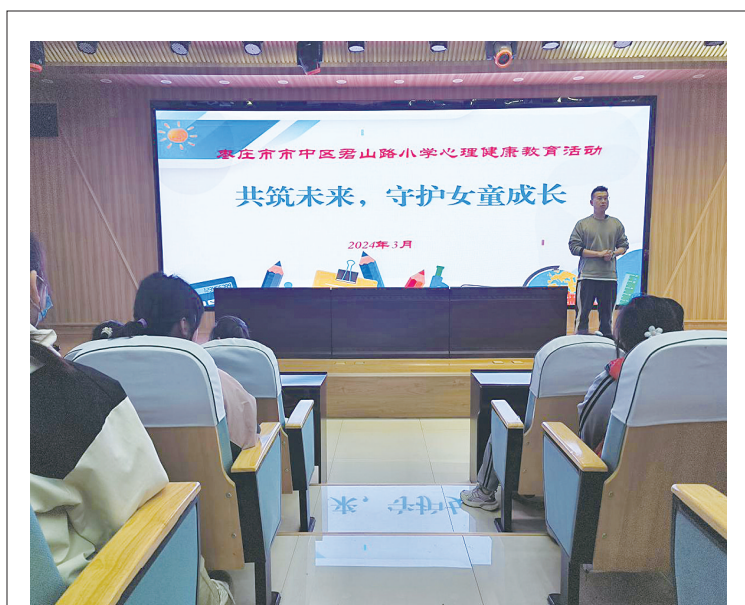
为提高学生的安全意识和自我保护能力，增强家校之间沟通，近日，市中区君山路小学开展“关爱女童”主题讲座活动。讲座中，教师向学生们深入浅出地讲解了女童可能遇到的安全隐患，并教授实用的自我保护技巧。

□通讯员 徐军先 塔塔埠讯 为提升群众体育生活满意度，丰富辖区居民文化体育生活，3月19日，塔塔埠街道举办“枣运动·枣健康”社区运动会。 此次运动会设有跳绳、踢毽子、自行车慢骑、两人三足共四个参赛项目，鼓励不同年龄段的居民参加，让他们通过运动，愉悦和放松身心，从而引导更多居民参与全民健身，以健康的体魄和饱满的精神共创美好生活。