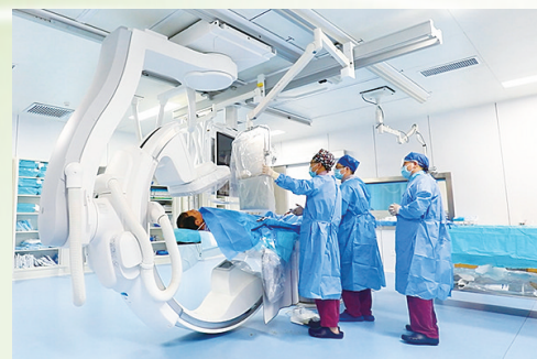
心脑血管介入中心