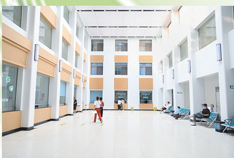
宽敞明亮的门诊大厅

风正潮平，自当扬帆破浪；任重道远，更需策马扬鞭！站在新时代、新起点，在区委、区政府的坚强领导下，市中区人民医院将牢记“以患者为中心”的宗旨，始终把保障人民健康摆在优先发展的战略位置，不忘初心、牢记使命，为人民群众提供更加有品质、有温度、高效率的医疗服务，奋力开创医院高质量发展新局面！