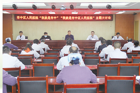
“我就是市中”区医院主题大讨论