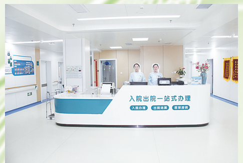
病房护士一站式服务