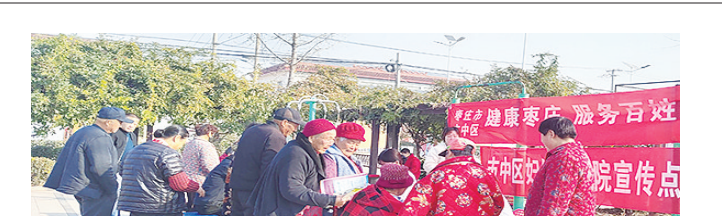
11月21日，市中区妇幼保健院的专家来到西王庄镇丁庄村开展义诊活动，并宣讲讲解相关健康保健知识，使医疗资源下沉到乡村，为广大村民搭建了便捷的健康咨询平台。