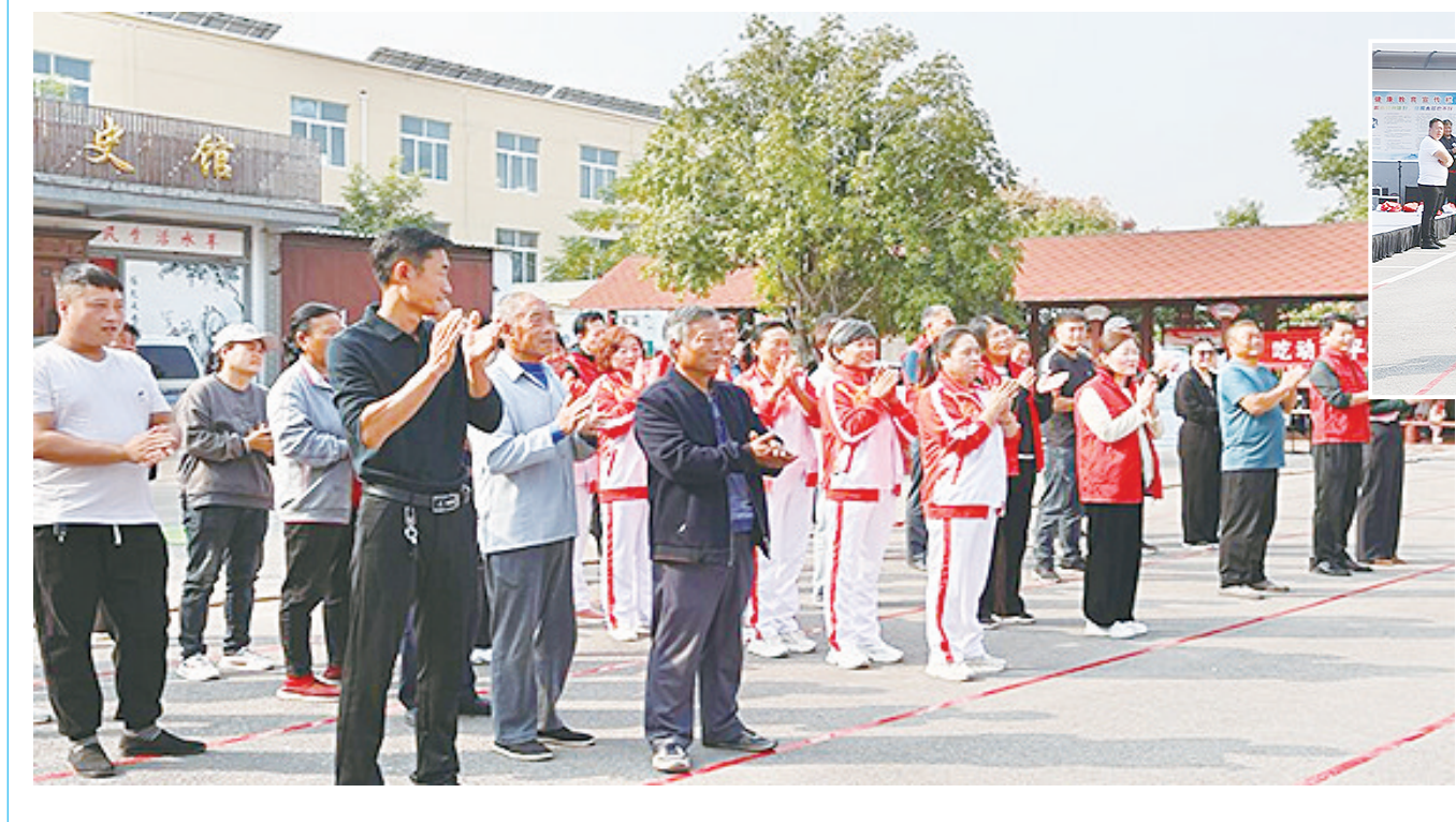
10月13日，“枣运动 枣健康”市中区第十三届全民健身运动会孟庄镇大郭庄村乡村趣味运动会在大郭庄村村委会院内热闹举行。 本次趣味运动会比赛项目围绕趣味性、运动性和安全性设置了“背地瓜跑”“背玉米跑”“剥花生”“自行车慢骑”等项目，让平时忙于劳动的村民既感受到了运动的乐趣，也丰富了群众精神文化生活，深受广大村民喜爱。