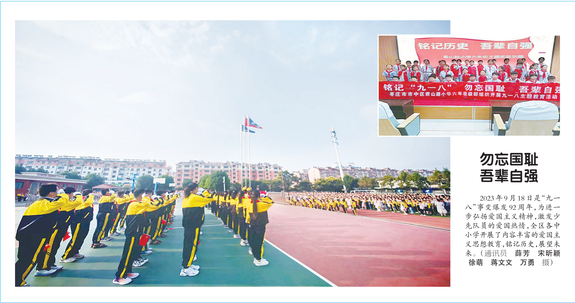
勿忘国耻 吾辈自强

持统筹协调,确保婴幼儿照护示范县(市、区)创建工作务实创新、成效明显。要探索多元共建,大力发展社区托育服务,面向家庭、面向社会,宣传推广婴幼儿托育服务,不断提高群众满意度。 会议指出,要明确目标责任,合理规划校车路线,做好车辆停靠站点周边场地整治和设施配备,给学生提供安全、方便的乘车条件。要规范运营管理,持续加大校车使用监管检查力度。要树牢安全意识,进一步加强校车安全管理运营,始终把校车安全摆在重中之重,层层筑牢校车安全屏障,真正让学生乘坐舒心、家长安心、社会放心。 会议强调,要认清严峻形势,主要领导靠前抓、亲自抓,切实做好永久基本农田内非耕地的整改问题。要细化工作措施,严格按照要求,抓紧整改、全面整改、彻底整改。要加强宣传引导,坚决防止“简单化”“一刀切”“运动式”整改,切实维护群众合法权益,确保社会安定稳定。 会议还研究了其他事项,并就经济普查、卫生城市复审、“三秋”生产等近期重点工作进行了安排部署。