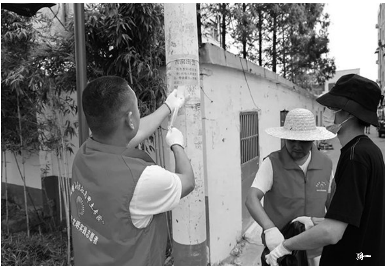
图一、图二 自创建全国文明城市工作开展以来，孟庄镇不断细化创建责任、完善创建措施、狠抓创建重点，大力开展综合整治，创城工作取得阶段性成效。对辖区重要路段两侧和人行道进行“地毯式”冲刷清洗，对背街小巷卫生死角和杂草进行专项整治，经过整治，街道面貌焕然一新。

□通讯员 空凡 龙山路讯 为推动“大干快上30天，城市旧貌换新颜”攻坚行动，全市“大拉练”活动，连日来，龙山路街道坚持“常态+攻坚”的创城工作模式，凝聚力量、聚焦重点、攻坚克难，严格按照创建标准和要求，全力推进全国文明城市创建工作。凝心聚力鼓斗志。龙山路街道把全国文明城市创建工作列为当前重点工作，不定期召开创建专题会议，及时协调解决工作推进中遇到的难点和问题。近日，街道又连夜召开创城工作加压会，传达市、区关于全国文明城市创建工作最新精神和要求，形成街道上下齐动员、创建工作一盘棋的良好态势。 常态长效补短板。龙山路街道做细、做实、做好日常工作，及时清理卫生死角、绿篱带、楼道内杂物及墙体上的非法小广告等；采取整束绑扎、弱电线”、外地制宜施划停车位，改善辖区乱停乱放问题；精致建设、着力打造兼具观赏性和实用性的精品游园等。 突出重点抓整治。龙山路街道实行执法人员错时上下班制度，在重点部位安排专人执法，坚决防止出现马路市场、占道经营现象。同时组织人员对新华市场、区委区政府驻地等重点及周边区域开展集中整治。强化督导促落实。龙山路街道组织人员成立督导组，采取明查与暗访、定期与不定期、自查与互查相结合的方式，对各社区的创城工作进行督导检查，抓好整改，真正将创建全国文明城市工作落到实处。