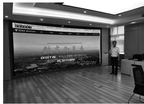
通讯员 袁月 西王庄镇 近年来，西王庄镇紧紧抓住新一代信息通信技术带来的重大机遇，结合