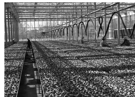
自身实际，明确建设重点，形成数字乡村发展合力，推进信息化与农业农村深度融合，为乡村振兴插上“数字翅膀”。

实施“互联网+”现代农业行动。西王庄镇整合辖区农业园区视频监控、大田视频监控、植保专家远程病虫害防治指导等多个系统，建设成为鲁南地区最大产学研一体化发展的现代化蔬菜工厂化育苗基地，助推传统农业产业向现代化、智能化、高效化迈进。 铺就“数字农村”信息网。西王庄镇坚持将农村信息化、农业信息化作为三农工作的重要抓手，按照有场所、有人员、有设备、有宽带、有网页、有持续运营能力的“六有”建社要求，已建成村级益农信息社标准社8个，其中专业社4个。 搭建群防群治智能监控平台。西王庄镇组建平安乡镇智控云平台，助力村干部第