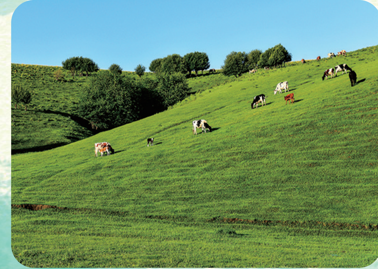
《青青牧场》

香，是那种收敛了锋芒宜人的香，是那种沁人心脾的香。人们闻着她的香，就像吸饮了玉露琼浆一样，神清气爽，眉目和悦。世上花，大都色花不香，香花不艳，唯有她将形色香完美融合。她是天生尤物，是上天的宠儿，是坠落凡尘的仙子。