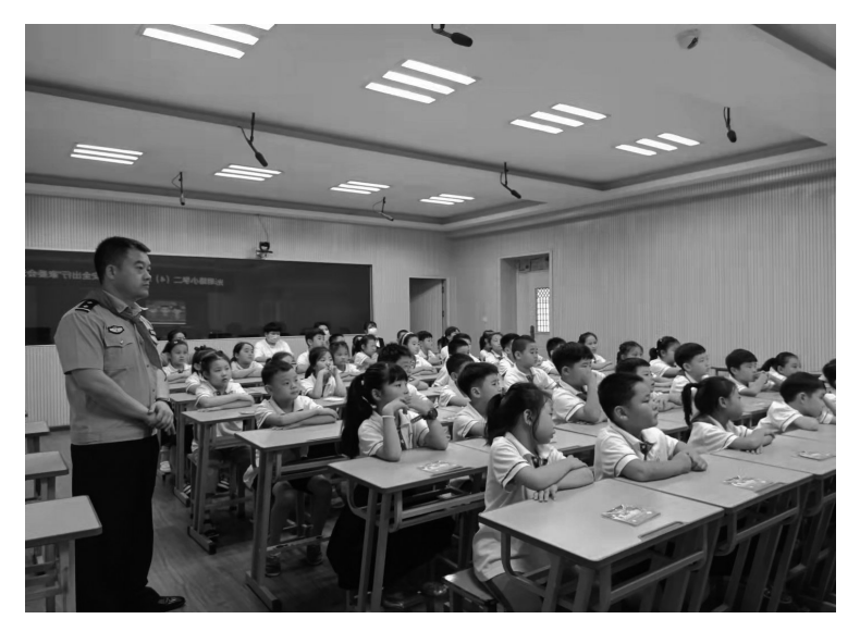
为进一步推进“交通安全进校园”宣传活动深入开展,加强对广大学生的安全出行教育,近日,光明路小学二年级四班举行了“关爱生命 安全出行”家委会活动。活动邀请了市公安局交警大队的民警为同学们上了一堂生动活泼的交通安全宣传课,重点围绕安全文明出行宣传主题,就一些基本交通安全知识给学生们作了详细地介绍及讲解,鼓励同学们争做文明交通的践行者。