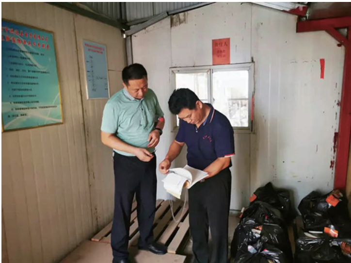
为提高辖区生态文明，建设和谐宜居的生活环境，近日，矿区街道分管同志及环保所一行深入辖区企业开展环保工作专项检查。检查组一行对辖区6家企业的除污环保设施、排污管道及排污口等进行全方位排查，对无治污设施、治污设施不正常运行的企业责令停产整治，对未取得排污许可证的企业，确保“发现一家、关停一家”，做到从源头治污绝不手软。