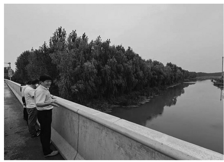
为加强孟庄镇河道水域管理保护及水质监督治理，严格落实河长制，实现河道保洁工作常态化和长效化。连日来，孟庄镇组织水利、环保、畜牧等相关部门人员组成巡查督导组对辖区内大小河道开展日常保洁和重点巡查工作，切实提升河道生态环境质量。