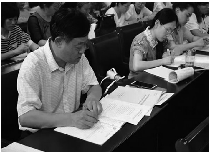
为进一步规范教师职业行为,纵深推进全面从严治党,全面提高教师职业道德水平,7月4日至10日,逸夫小学利用暑假放假一周时间开展了“师德师风问题大排查大整治专项学习”。会上,全体教职工签订了《枣庄市中小学教师师德师风承诺书》,共同学习了《新时代中小学教师职业行为十项准则》等相关文件,扎扎实实地开展学校师德师风大排查、大学习、大整顿工作。