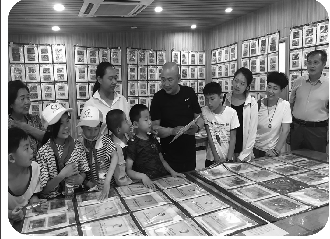
在中国共产党百年华诞来临之际，枣庄翰墨书院、市收藏家协会红色收藏委员会、区关心下一代工作委员会等部门联合举办了庆祝中国共产党成立100周年“真情关爱 点亮童心——永远跟党走”“牵手困境儿童”系列主题活动，社会各界300余人参加了本次活动。大家共同参观了“党的光辉照我心”——毛泽东红色文化收藏展和抗战史、史料展以及报纸、连环画、票证等收藏展。据悉，这次收藏展共展出徽章600余枚、报纸、连环画1000余册（张），史料图片展板200块，抗战时期的军用品200余件。